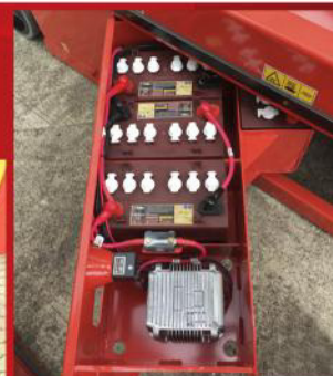
Gabinete de baterías