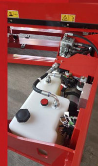
Gabinete sistema hidráulico